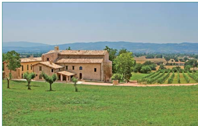
Vue du complexe de San Masseo

Des jours de retraite individuelle et de révision de vie en tout temps de l'année, avec un membre de la communauté (écrire ou téléphoner pour se mettre d'accord à l'avance).