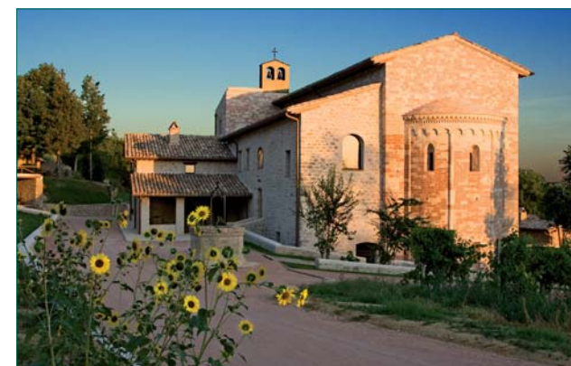
San Masseo est situé à mi-hauteur de la colline d'Assise entre Sainte-Claire, Saint-Damien et la Portioncule.