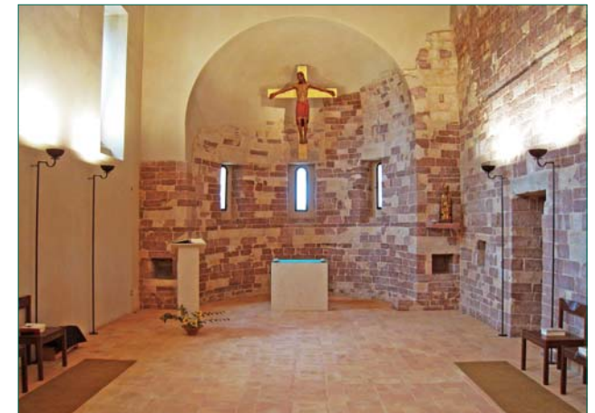
Église de San Masseo

On considérait récemment encore que seule la crypte romane subsistait de l'ancienne église bénédictine du XI e siècle. Mais la nef et le sanctuaire sont en réalité conservés, comme cela ressort de la restauration actuelle, menée de concert avec la Direction régionale et la Surintendance aux biens architecturaux et paysagers d'Ombrie. L'église existe donc encore, avec tous les signes de son temps. Cette église est consacrée à saint Matthieu l'Évangéliste , et son nom, qui remonte à une matrice byzantine, aurait été transformé en San Masseo dans le dialecte local.