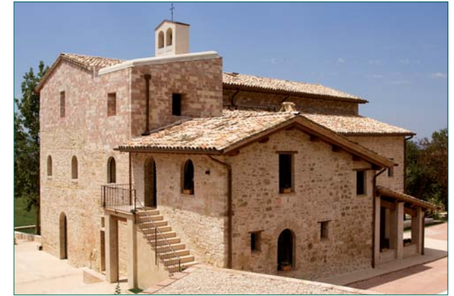
Vue de l'édifice principal de San Masseo – côté nord-est

On pense, traditionnellement, que la localité de San Masseo était le premier refuge où l'on abritait les cas suspects de lèpre (voir l'épisode du baiser de saint François au lépreux). San Masseo aurait été pour saint François un lieu de halte et de prière : certains voudraient même y voir la crypte où, selon Thomas de Celano, François Patrem in abscondito exorabat et où il latitavit . Mais auparavant déjà, en mai 1130, l'église de San Masseo est cédée, avec tous ses biens, à l'abbaye de la Sainte-Croix de Sassovivo, dont elle représente un centre commercial et de subsistance fondamental, et sous la juridiction de laquelle elle demeure jusqu'en 1503, lorsque le prieuré de San Masseo est incorporé aux biens de l'abbaye de Saint-Pierre d'Assise.