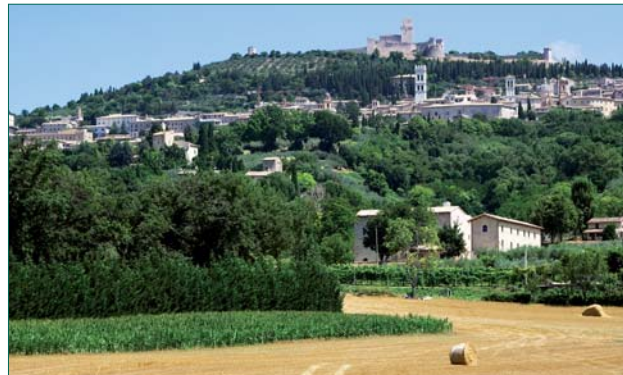
Vue du complexe de San Masseo

Le complexe, central par rapport au cadre naturel qui l'entoure, est situé aux pieds du relief sur lequel s'élève la ville , lequel peut lui-même être vu comme assis en rapport au Mont Subasio. Établi entre Saint-Damien, la Portioncule et Sainte-Claire, le monastère de San Masseo se trouve le long de la via Petrosa, qui montait des champs de la vallée de Spoleto jusqu'à la Porte Mojano, en quittant la via Francesca. Au centre d'un bassin hydrographique qui forme une sorte d'amphithéâtre naturel, placé sur l'axe médian de la ville et limité par les deux fossés, celui de Mojano et celui de Santureggio, le prieuré de San Masseo recouvrit de sa structure agricole un drainage romain, perfectionnant la technique d'irrigation et le rendement des vastes terrains fonciers, des ateliers et des moulins dont il disposait.